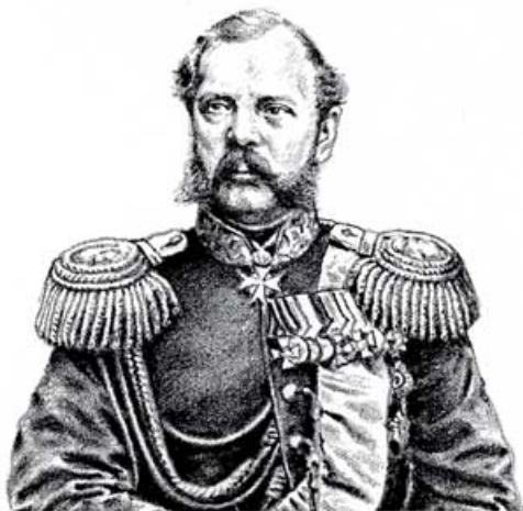
Alexander II. von Rußland

den Ausdruck der Macht und Einschüchterung erzielen wollen, betonen aus diesem Grund ihre Schultern.