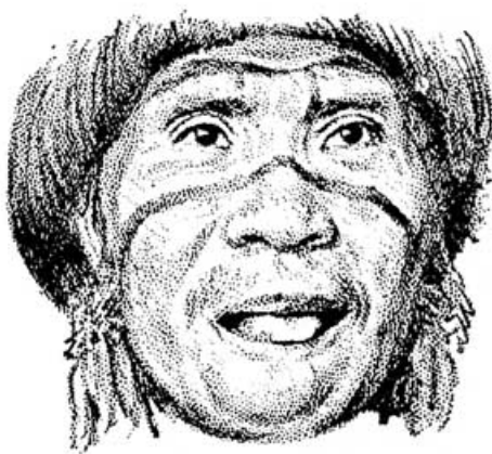
Ein flirtender Waika-Indianer

Zum Flirten gehört auch das Züngeln, ein kurzes Vorstrecken der Zunge, eventuell mit kurzer Leckbewegung in der Luft. Auch Naturvölker flirteten auf diese Weise.