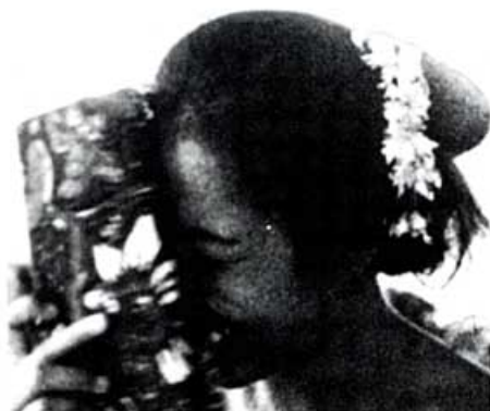
Die Gestik der Verlegenheit bei einer Balinesin. Sie verdeckt das Gesicht als Reaktion auf ein Kompliment

Bei Verlegenheit wird das Gesicht ganz oder teilweise verdeckt.