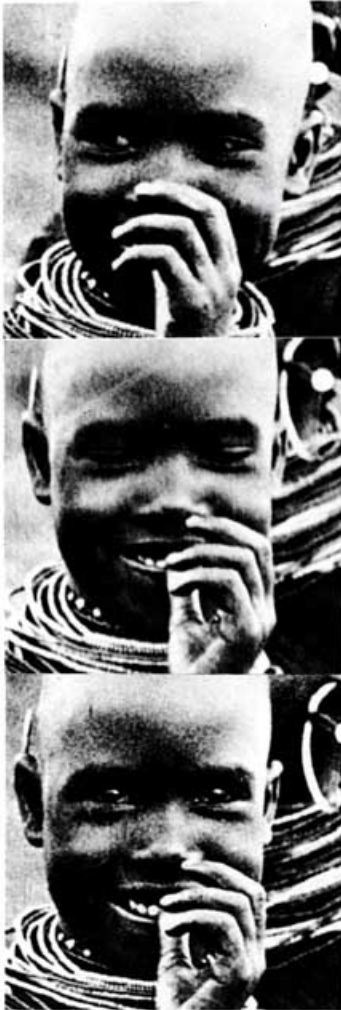
Flirtendes Samburu-Mädchen in drei Phasen des Flirts: Blickkontakt, Lidschluß, Wegsehen und neuer Blickkontakt. Die Hand verdeckt verschämt den lächelnden Mund

Typisch für den Ausdruck des Flirtenden ist die Zuwendung (Blickkontakt) und die anschließende schnelle Abwendung (Kopfsenken, Lidschluß oder Wegsehen). Danach wird der Blickkontakt jedoch erneut aufgenommen.